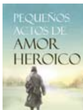
Pequeños actos de amor heroico Danny Scheinmann / Almuzara

La novela relata la historia de un joven atrapado entre dos religiones y dos amores, en busca de su libertad y la de su pueblo, en la Andalucía del siglo XVI (1568). En el agreste paisaje de la Alpujarra granadina, los moriscos sobreviven gracias a su duro esfuerzo a pesar de los incesantes obstáculos que les imponen los cristianos viejos. Obligados a venerar unos símbolos religiosos en los que no creen, su descontento crece hasta estallar en una revuelta cruel y sangüinaria. Entre los sublevados se halla Hernando, un joven de catorce años que ha sufrido el rechazo de su gente debido a su origen: su madre, Aisha, fue violada por un sacerdote y él, apodado el nazareno, es el fruto de dicho ultraje. Los lectores de La catedral del Mar encontrarán en esta segunda novela de su autor las mismas claves que llevaron al éxito a la primera: la fidelidad histórica, que se entrelaza con un apasionado relato de amor y odio, de ilusiones perdidas y esperanzas que dan sentido a la vida y la lanzan por los caminos de la aventura.