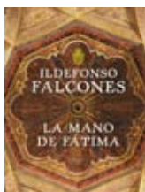
La mano de Fátima Ildefonso Falcones / Grijalbo

no es el cultivo de la tierra lo que deja ganancias, sino la carne. Son varias las familias que arriendan esas tierras, pero el encargado tiene un orden tajante: expulsarlas. Y todos, finalmente, se marchan. Todos, excepto los O'Brien, que seguirán allí. Entre la espada de la persecución del propietario y la pared de la plaga que destruirá las cosechas de patata y provocará la gran hambruna de esos años, la familia es exterminada por el tifus, el hambre y los esbirros del dueño, que incendian las cabañas con los moribundos dentro. Sólo se salva Fergus, el hijo mayor, casi un niño, que se verá obligado a crecer muy rápido. Y así comienza el largo viaje del muchacho hacia no sabe dónde movido por la ley de los sueños (y de la supervivencia) que dice que hay que seguir.