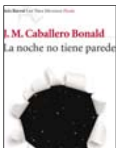
La noche no tiene paredes J.M. Caballero Bonald / Seix Barral

Tres años después de su memorable “Manual de infractores”, José Manuel Caballero Bonald reúne un centenar de poemas recorridos por un tono semejante y por la presencia de una serie de temas característicos de su literatura y su mitología personal.