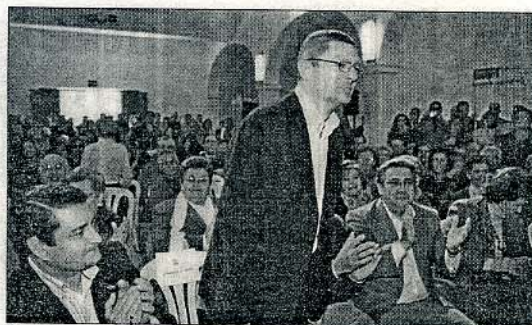
Ruiz Gallardón, ayer en la convención del PP de Sevilla.

«miles de cazadores tienen que pagar las tasas y, si no, les multan y les meten en la cárcel», además de preguntarse cómo «estando acompañando al ministro» el Seprona de la Guardia Civil, «no se le pidiera la licencia y si cumplía las normas».