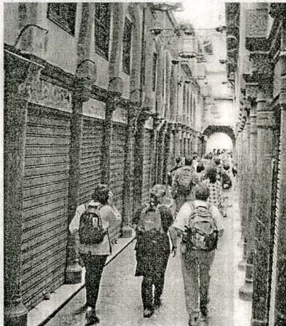
Los viajeros literarios recorrerán la Alcaicería.

los Reyes Católicos pasó a Casa de la Moneda. También fue convento, casa de vinos y cárcel de la ciudad hasta acabar en las actuales ruinas.