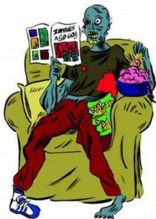
Los zombis están muy vivos y bien adaptados al siglo XXI.