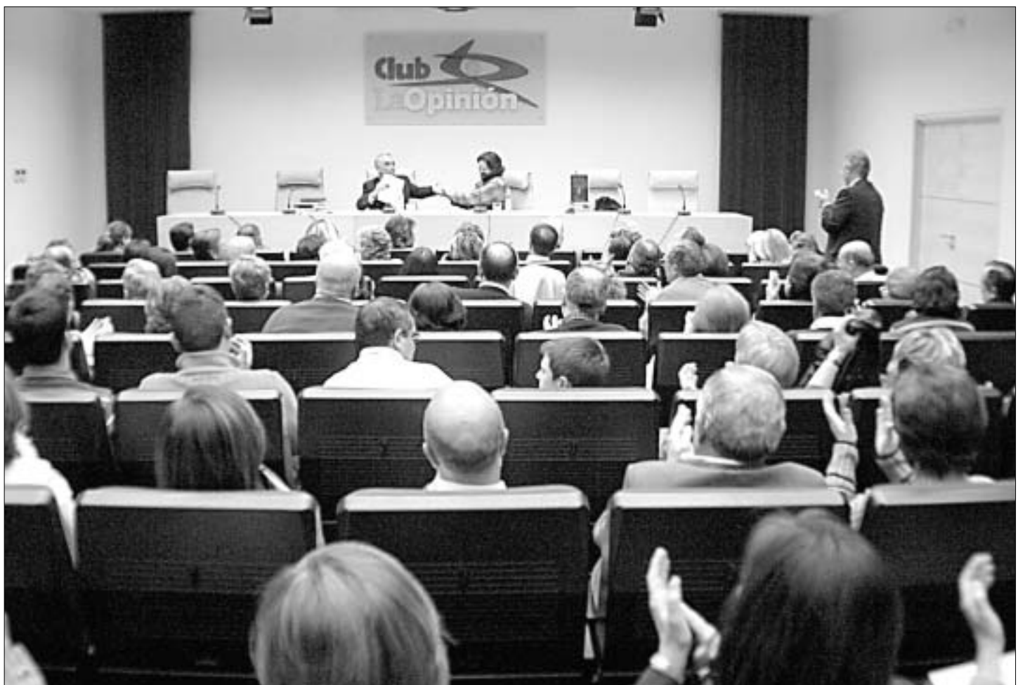
El público asistente al Club La Opinión aplaudió la presentación del libro