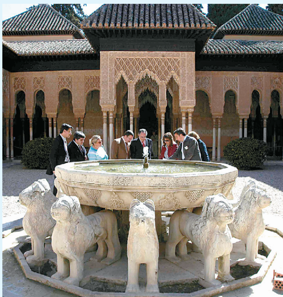
Patio de los Leones en la Alhambra granadina.

mantener su cuota de poder. Para González Ferrín, Al Ándalus nació del Islam y el Islam se fue haciendo mayor en Al Ándalus, uno de los pilares de una fe, una cultura y una creencia religiosa que aún daba sus primeros pasos cuando sus seguidores desembarcaron en tierras españolas. La obra no trata de tirar por la borda siglos de historia, pero recuerda que Al Ándalus fue mucho más que lo que hoy es Andalucía, que la convivencia no fue ni tan pacífica ni tan mala como ahora se quiere pintar, que aquellos años de gobierno 'islámico' pusieron en el mapa del mundo entonces conocido a la península, que aquellos reinos omeyas y nazaríes comenzaron el renacimiento europeo, porque al fin y al cabo aquello también era Europa, que el lenguaje y la sociedad se enriquecieron con aportaciones mutuas... que todo aquello fue más que el puro tópico hoy vigente. Y en nuestro presente echar la vista atrás sin acritud se agradece.